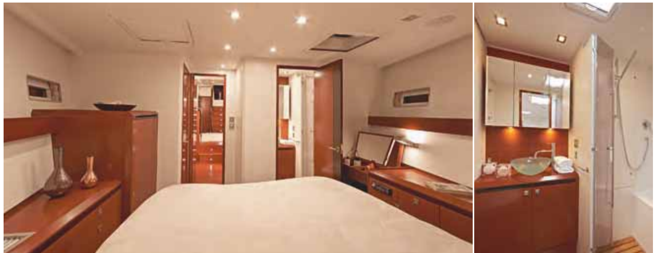
Cabine propriétaire (avant) - Owner's state room (forward)