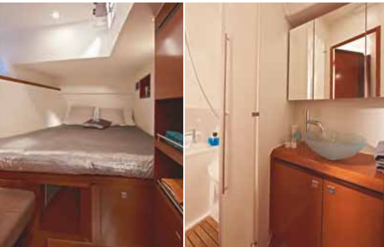
Cabine invités (arrière tribord) - Guest cabin (starboard aft)

Each cabin has excellent built-in storage, and its own en suite toilet with separate shower.