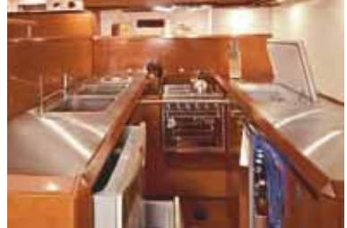
6, 7, 8, 9 & 10