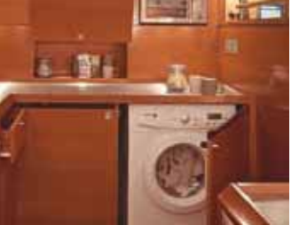
16, 17, 18 & 19